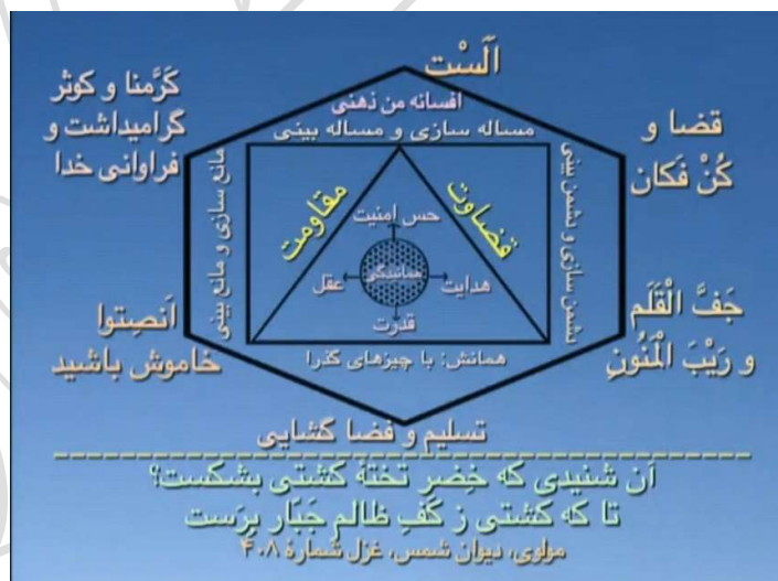
شکل شماره ۷ (شش محور اساسی با افسانه من ذهنی)

اگر با این شکل (افسانه من ذهنی) می روید وارد جهنم من ذهنی خواهید شد و نجات نمی توانید پیدا کنید، این شخص همه اش از عقل جزوی اش و از عقل همانندگی ها استفاده می کند، همراه با قضاوت و مقاومت. این شخص (حقیقت وجودی انسان) قضا گشایی می کند، صبر و شکر دارد، پرهیز می کند از همانیدن، و دارد پیشرفت می کند، به تدریج قضا درونش باز می شود، گفتیم قضا آنقدر باز می شود که انسان به بی نهایت خدا زنده می شود، اندازه خدا نمی شود، ولی به اندازه باز شدنش عمق یا وسعت پیدا می کند، هر چه که وسعت درون ما زیادتر می شود ما از گذشته و آینده داریم جمع می شویم، داریم می آییم به این لحظه، یک دفعه متوجه خواهیم شد که دیگر در این لحظه هستیم و زمان روانشناختی گذشته و آینده تمام شده، برای اینکه ما دیگر از جنس جسم نیستیم.