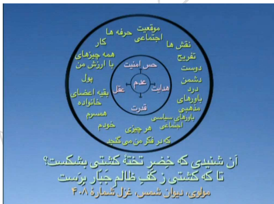
شکل شماره ۲ (دایره عدم)

یک مطلب دیگر که سریع بگویم آن است که هر چیزی در مرکز ما قرار بگیرد ما چهار تا خاصیت را از آن بیرون می‌کشیم یکیش عقل است، عقل توانایی شناسایی ماست، حس امنیت است حس امنیت یعنی چقدر آرامش داریم. و آرامش داشتن و نداشتن را شما می‌شناسید. و یکی هم هدایت است که به چه سمتی رانده می‌شویم ما، آیا این زیاد شدن همین چیزهایی که در مرکز ما هستند، ما را هدایت می‌کند؟ یا هیجانانگیز ما، دردهای ما مثل خشم و ترس و واکنشهای منفی ما را هدایت می‌کنند. یا همینطور که در شکل بعدی خواهیم داشت عدم یا خدا؟ یکی هم قدرت قدرت، قدرت عمل کردن ماست و روبه رو شدن به چالشهاست که هر چهار تا را از این چیزهایی است که در مرکز ما هست می‌گیریم. چون اینها آفل هستند گذرا هستند همه این چیزها، این چهار تا خاصیت هم البته که آفلند