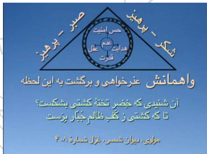
شکل شماره ۴ (مثلث واهمانش)

این قضاوت و مقاومت ما با قضاوت و کن فکان خدا اصلاً جور نیست، این بیت هم همین را می گوید، می گوید: خدا این کشتی را سوراخ می کند، لطمه می زند، تا من ذهنی شما و من های ذهنی اطرافتان از آن نتوانند استفاده کنند، تا در اختیار خدا قرار بگیرد.