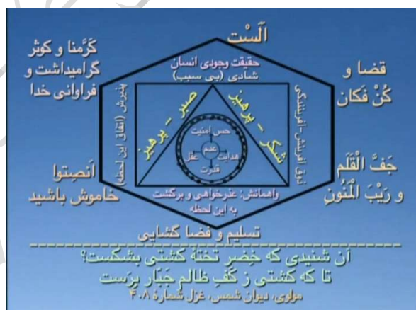
شکل شماره ۸ (شش محور اساسی با حقیقت وجودی انسان)

و جَفَّ الْقَلَمُ که در واقع یعنی انعکاس مرکزمان در بیرون، هر لحظه اتفاق می افتد، و این شخص می بیند که مسئله سازی می کند، مانع سازی می کند، فکر می کند مانع ها، مسائل بیرونی که در جامعه هست و دشمن های بیرونی شکل وضعیت ها را در بیرون تعیین می کنند، بنابراین در سبب سازی هم اشتباه دارد، بعضی موقع ها اتفاقات بسیار بسیار ناگوار برایش اتفاق می افتد.