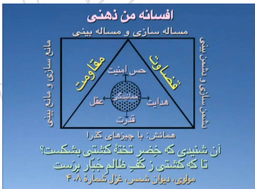
شکل شماره ۵ (افسانه من ذهنی)

هفته های گذشته این اصطلاح تَقْوَى الْقُلُوبِ را داشتیم، یعنی تقوای قلب، کسی که واقعاً قلباً پرهیز می کند و این پرهیز را دوست دارد، چون مرکزش از جنس عدم است. پس بنابراین، این هم مثلث واهمانش است، زندگی وقتی این حالت (مثلث همانش) ما را می گیرد، کشتی را سوراخ می کند و انتظار دارد که شما اعتراض نکنید، و تبدیل شوید به این حالت (مثلث واهمانش)، یعنی عذر بخواهید به جای واکنش نشان دادن. دو تا رفتار هست: یکی اینکه شما تلخ بشوید و ناسزا بگویید، در این حالت (مثلث همانش)، درد را زیاد کنید، یکی اینکه نه، (مثلث واهمانش) ناسزا نگویید، واکنش نشان ندهید، و از خدا عذر خواهی کنید، و بیاید به این لحظه، یعنی قاعده مثلث، این هم مثلث واهمانش است، دیگر می دانید.