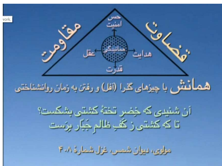
شکل شماره ۳ (مثلث همانش)

به خدا، هیچ آرزویی برای من نماند، یعنی من به این شکل (دایره عدم) تبدیل شدم، این آرزوها را راندم به حاشیه، و عدم را در مرکز گذاشتم، بله، کاملاً مشخص است این، با این ابیات این دو شکل کاملاً باید جا بیفتد برای شما.