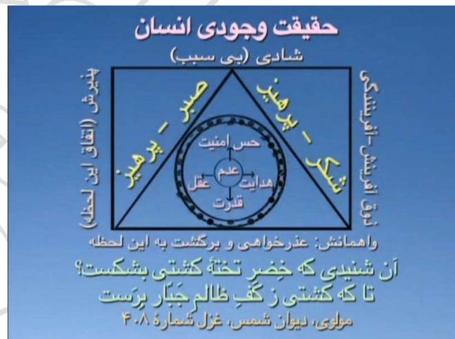
شکل شماره ۶ (حقیقت وجودی انسان)

و مآلاً افسانه من ذهنی را خواهید ساخت، یعنی کارهای زندگی: قضا و کن فکان را شما به صورت مانع، مسئله و دشمن می بینید، خیلی ها فکر می کنند خدا دشمن شان است، وقتی کشتی را سوراخ می کند، فکر می کنند که این همانیدگی ها در واقع مال آنهاست و باید این را نگه دارند، و نمی شود اینها را از دست بدهند، نمی دانند جور دیگر هم می شود زندگی کرد، عدم را نمی شناسند، و افتخار می کنند به انباشتگی ها در مرکزشان. در نتیجه هر چه خدا سوراخ می کند کشتی شان را فوراً تعمیر می کنند، سوراخ می کند تعمیر می کنند، ولی آخر سر دیگر نمی توانند تعمیر کنند، چون ممکن است واقعاً همه چیز فرو بریزد، یک دفعه می بینید بیست تا چیز با هم فرو ریخت، و این شخص بیشتر تلخ شد، یا مریض می شود، یا از بین می رود، نمی خواهیم این سرنوشت را پیدا کنیم، اسمش افسانه من ذهنی است.